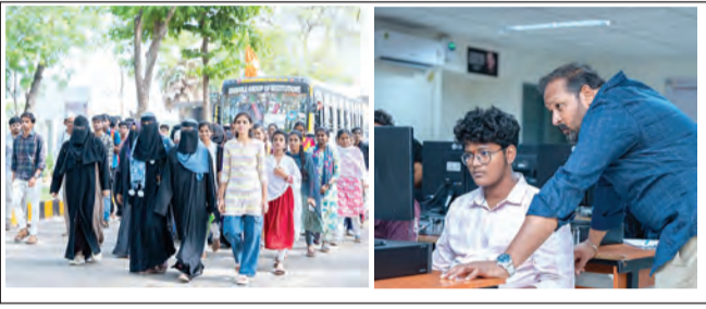
కడప, మే 01, ప్రభాతవార్త