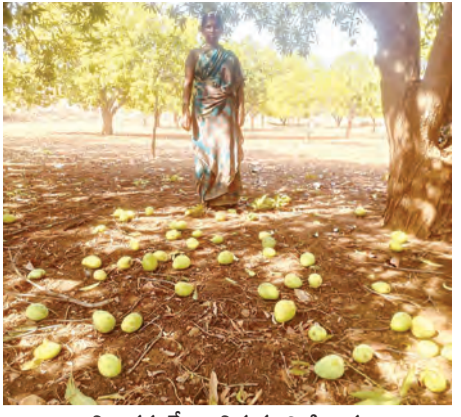
గాలివానకు నేలరానిన మామిడికాయలు

లక్ష్మిరెడ్డిపల్లి మండలంలో గురువారం రాత్రి గాలి వాన బీభత్సానికి ఆరా కొరకాసిన మామిడి కాయలు నేలపాలయ్యాయి బి ఎర్రగండి కోలపేట చెంపల్లపల్లి దప్పపల్లి వీరారెడ్డి గారి పల్లి గ్రామాలలో గాలివానకు మామిడికాయలు నేలరాని అందులో ఏడాది ఆరే త్వరగా కాసిన మామిడి కాయలు గాలివానకు నేలపాలయ్యాయి ఈ ఏడాది కనీసం 25 శాతం కూడా మామిడి కాయలు కాయడం లేదు దీంతో రైతు దిగులుగా ఉన్న సమయంలో గాలివాన వైపరీత్యాల రైతుల నష్టాల ముంచేసింది ప్రభుత్వం ఎలాగైనా ఆదుకోవాలని మామిడి రైతుల కోరారు